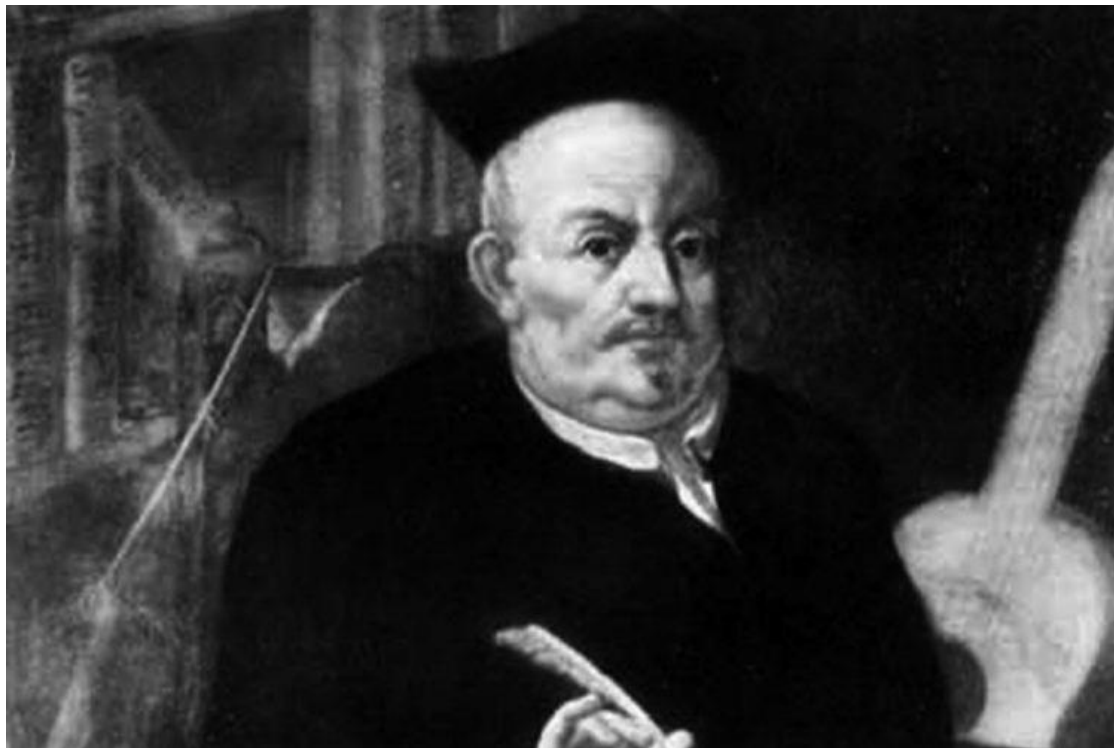
Vicente Espinel es una de las grandes figuras literarias españolas. Además, fue músico y puede decirse con propiedad que fue el primer cantautor español.